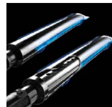
4 Dual-Tube™ Brenner aus Edelstahl