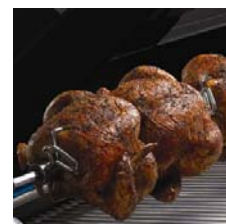
Rückenbrenner aus Edelstahl inkl. Drehspeiss mit Elektromotor.