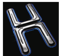
Dual-H™ Brenner aus hochwertigem Edelstahl mit 326 Gasöffnungen.