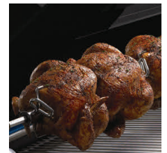
Rückenbrenner aus Edelstahl inkl. Drehspieß mit Batteriemotor.