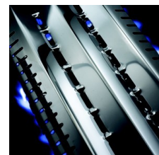
Système arôme Flav-R-Wave™