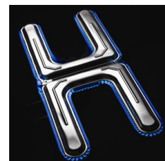
Brûleur Dual-H™ en acier inoxydable