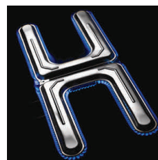
Dual-H™ Brenner aus hochwertigem Edelstahl