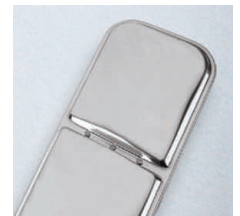
Dual-Oval™ Brenner aus hochwertigem Edelstahl