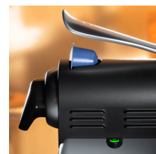
Beleuchtete Bedienungstasten für Kaffeebezug

DKB Household Switzerland AG Eggbühlstrasse 28 Postfach 8052 Zürich, Switzerland Tel. +41 (0)44 306 11 11 Fax +41 (0)44 306 11 12 http://www.dkbrands.com