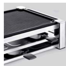
Mit Kaltzone als Pfännchenablage

Artikel Nr. _____ B02157 Farbe _____ Chrom / schwarz Masse (der Verpackung) _____ B 334 mm / H 166 mm / L 550 mm Verpackungsart _____ Kartonschachtel bedruckt